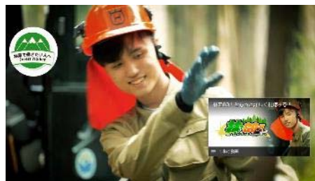
(事業1：イメージ動画)