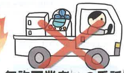
無許可業者への委託