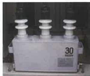
コンデンサ(蓄電器)