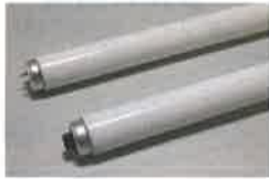
蛍光灯（直管形・電球形）