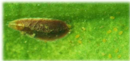
雌成虫と孵化幼虫(体色黄色)

ヤノネカイガラムシの薬剤防除適期は、 第1世代は、第1世代幼虫初発日の30~35日後(アプロード剤、モメントフロアブルは20~25日後) です。 第2世代は、第2世代幼虫初発日の30日後頃 です。