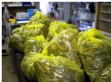
写真2: 25℃の室内で飼育