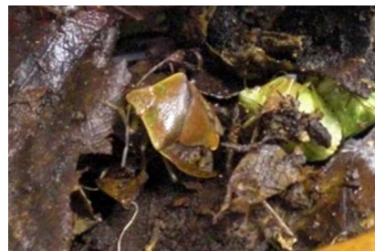
写真3: チャバネアオカメムシ越冬成虫