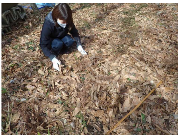
写真1: 越冬場所である落葉を採集