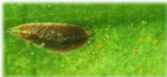
雌成虫と孵化幼虫(体色黄色)

ヤノネカイガラムシの薬剤防除適期は、 第1世代は、第1世代幼虫初発日の30~35日後(アブロード剤、モベントフロアブルは20~25日後) です。 第2世代は、第2世代幼虫初発日の30日後頃 です。