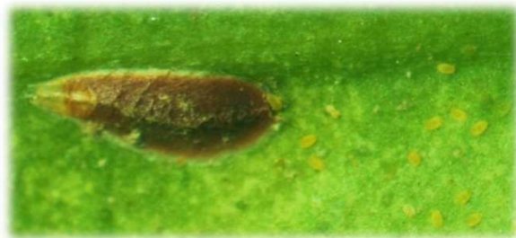
雌成虫と孵化幼虫(体色黄色)

ヤノネカイガラムシの薬剤防除適期は、 第1世代は、第1世代幼虫初発日の30~35日後(アブロード剤は20~25日後) です。 第2世代は、第2世代幼虫初発日の30日後頃 です。