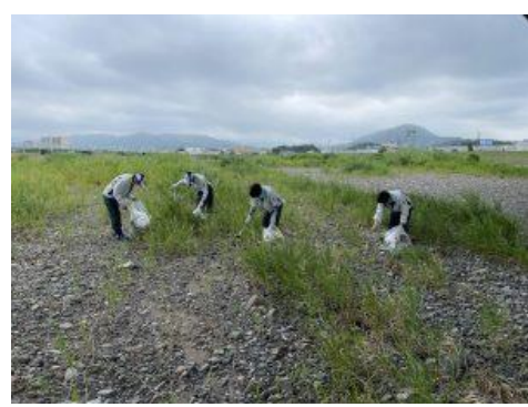
○重信川クリーン大作戦（2021年10月）