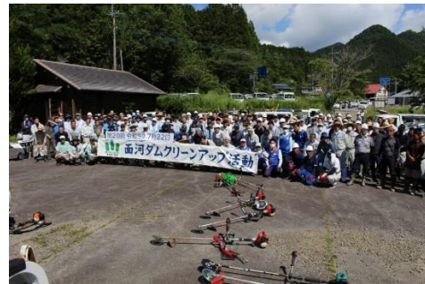
○面河ダムクリーンアップ活動 （2023年7月）