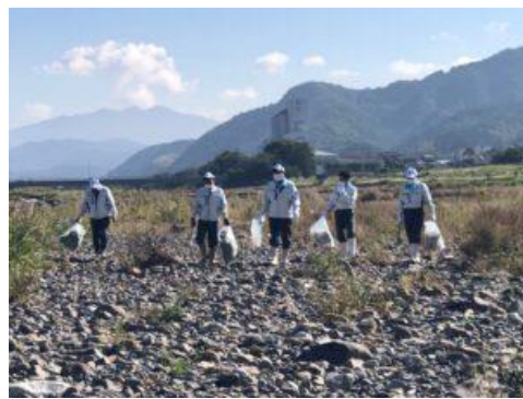
○重信川クリーン大作戦（2022年10月）