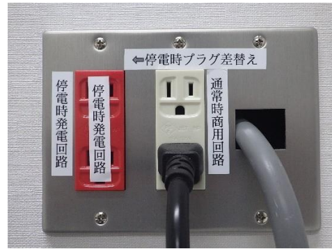
○停電時発電回路プラグ