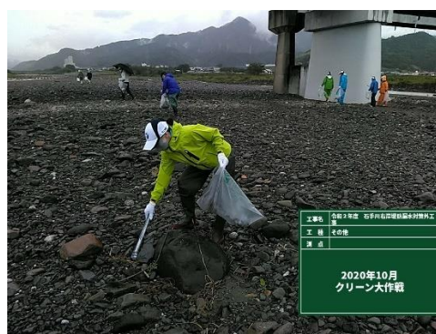
○重信川クリーン大作戦（2020年10月）