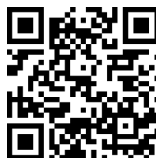
【申し込み用二次元コード】