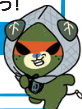
ダークみきちゃん