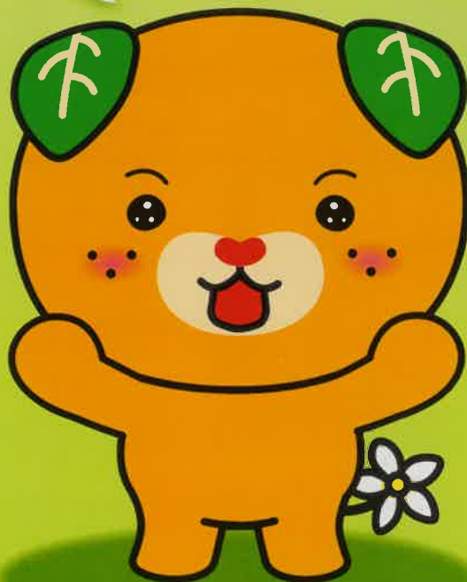
愛媛県イメージアップキャラクター みきゃん