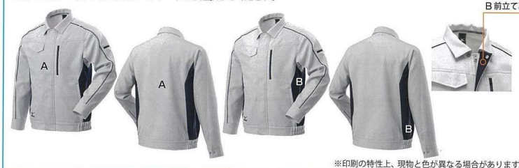
※印刷の特性上、現物と色が異なる場合があります。