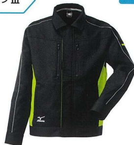
※画像はオーダーデザインの一例です。