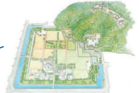
城山公園：堀之内地区（完成予想図）