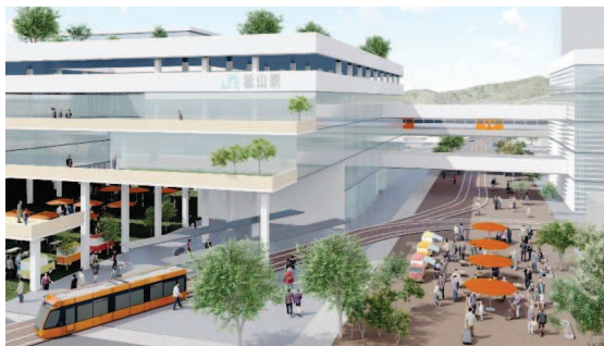
JR松山駅周辺まちづくりプラン