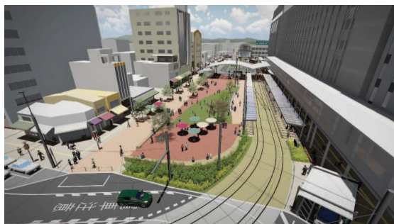
松山市駅前広場（完成予想図）