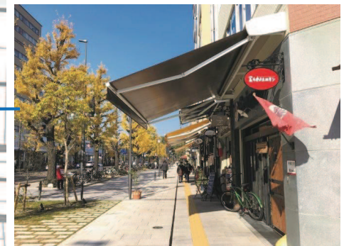
花園町通り（整備済）