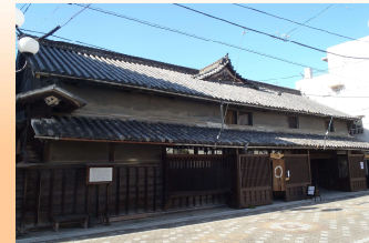
『宮内家住宅』 (国登録有形文化財)