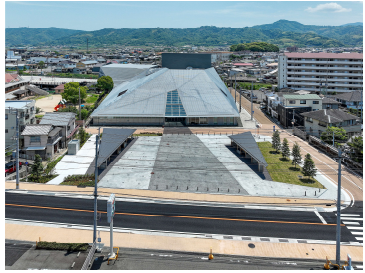
伊予市文化交流センター IYO夢みらい館

事業主体：伊予市 実施期間：平成28年度～令和2年度（第Ⅰ期） 令和3年度～令和7年度（第Ⅱ期） 令和8年度～令和12年度（第Ⅲ期）