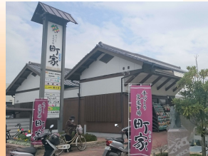
手づくり交流市場『町家』