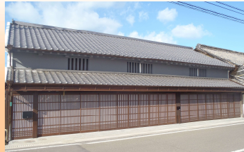
『木村家住宅』 (平成30年助成金整備)