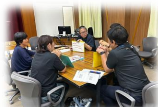
参加者等との意見交流