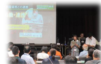
地域で活動する高校生の事例発表