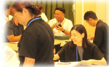
参加者どおして 互いの取組等について意見交流