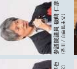
衆議院議員 長谷川 洋二 (愛媛3区/自由民主党)