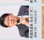
衆議院議員 長谷川 洋二 (愛媛3区/自由民主党)