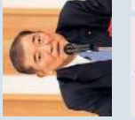
衆議院議員 石破 茂 (鳥取1区/自由民主党)