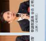
衆議院議員 長谷川 洋二 (愛媛3区/自由民主党)