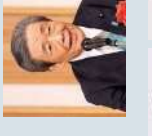
衆議院議員 森山 裕 (鹿児島4区/自由民主党)