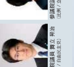
衆議院議員 長谷川 洋二 (愛媛3区/自由民主党)