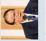
参議院議員 山本 順三 (愛媛/自由民主党)