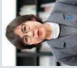
自由民主党 整備新幹線等鉄道調査会 会長/衆議院議員 稲田 朋美 (福井1区/自由民主党)

かつては、新幹線が無敵の象徴のように言われた時代もありましたが、決して無敵ではなくなり、高市内閣の「責任ある積極財政」において、危機管理投資の一つである国土強靱化を実現するためにも、全国の新幹線ネットワーク整備が必要です。整備計画と基本計画は、二項対立ではなく一緒に進めていかなければなりません。一歩ずつ確実に歩みを進め、まずは法定調査の早期実施に向け、共に頑張っていきたいと思います。