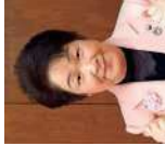
羽越新幹線建設促進同盟会 会長/奥羽新幹線建設促進同盟会 会長/山形県知事 吉村 美栄子

太平洋側と比べ、日本海側は歴然とした新幹線の整備格差が生じています。羽越・奥羽両新幹線の整備は、日本海側の人的交流の拡大や地域間の連携を加速させ、国土強靱化や地方創生の実現に向けた基盤となるのです。また、山形新幹線米沢延伸（仮称）は、全国の新幹線ネットワークの安定性向上にも寄与し、将来の奥羽新幹線実現の足がかりともなるものです。こうした新幹線ネットワークと一体として機能を発揮する幹線鉄道の機能強化の予算の大幅な拡充についても、政府に対して要望していきます。