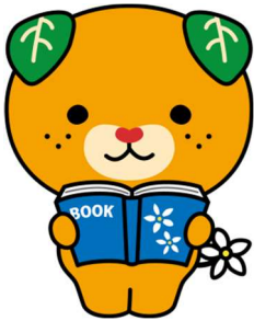
愛媛県イメージアップキャラクター みきゃん