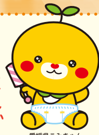
愛媛県こみきやん