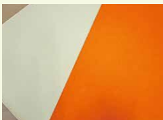
いよかん人工皮革 (株)モノツク工業