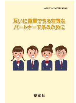
高校生のためのDV未然防止講座資料（令和2年度作成）