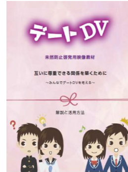
デートDV未然防止啓発用映像資料（令和元年度作成）

【ねらい】 今、社会で起こっている DV や性暴力等の人権侵害が起こるメカニズムを理解し、お互いを尊重する関係について考える。そして、自身がそのような状況になったときや友人から相談を受けた時の対応を学ぶ。 【内容】 講義（デートDV、DV、性暴力、ジェンダーバイアス、男女共同参画社会の構築）