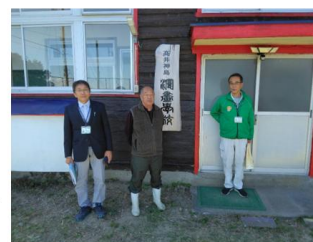
2024年11月21日 役場職員と打ち合わせ

2月 5~ 6日 「泉原邸」整備、「漫画学校」会場整備 報告(福武財団助成申請に関して)