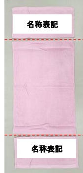
名称部の切り取り