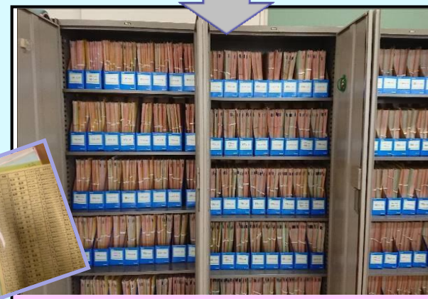
改善後のカルテロッカーとカルテ