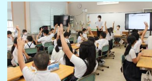
市内小学校での出前授業