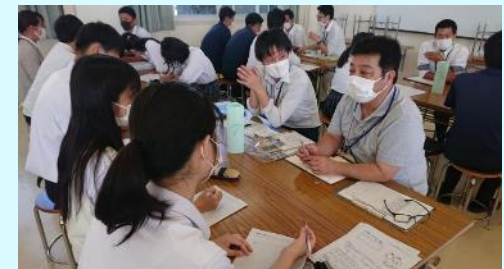
市職員への聞き書き