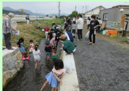
管理用水で生き物調査