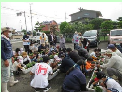
植栽による景観形成活動