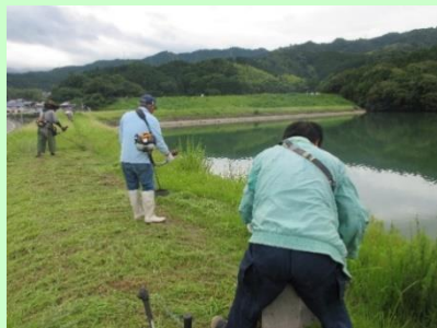
ため池周辺の管理

また、集落の寄合などで住民が集まる集会所 周辺 の 農地や水路、農道付近に景観形成活動として植栽したプランターを設置しています 。近年の高温や少雨などの異常気象で、景観形成作物の栽培管理が難しくなっていますが、絶やさぬよう努力しています。