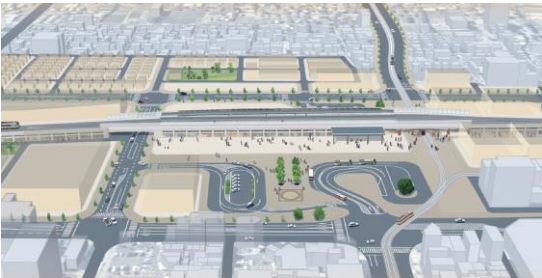
JR松山駅周辺（完成予想図）