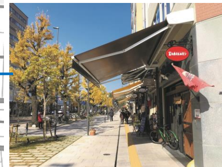
花園町通り（整備済）