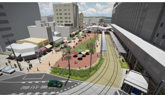
松山市駅前広場（完成予想図）