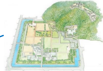
城山公園：堀之内地区（完成予想図）