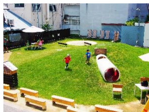
みんなのひろば(閉鎖)

2014～2019年 湊町三丁目に拠点施設を整備。 ・みんなのひろば ・もぶるテラス