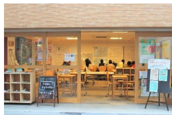
もぶるテラス(移転)