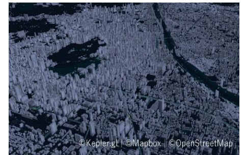
スマートシティプロジェクト

学生と社会人、さまざまな世代の市民が、地域資源を生かし、新たな公共空間の構想と計画を実践する市民参加型学習プログラム。