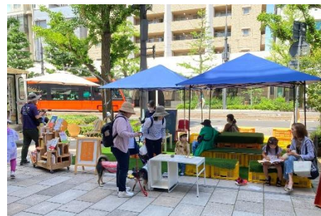
公共空間の利活用

公共空間の利活用を通じ、市民が思い思いの時間を過ごす多様なまちなかの居場所作りを後押しし、シビックプライド向上や、市民が主体となったまちづくり活動の継続・発展を図る。