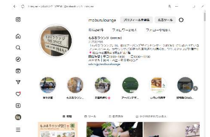
情報発信プロジェクト

まちづくり活動の場として市民等の活動を支援できる機能と情報を兼ね備えた施設を目指すとともに、憩いや交流の場として市民等に関われた施設の運営に取り組む。