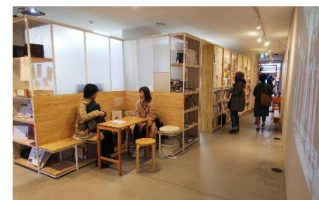
拠点施設(もぶるラウンジ)の運営

松山市の都市形成の歴史や将来予測に関するリサーチを通して、公民学に共有される松山全体の都市ビジョンを構築。