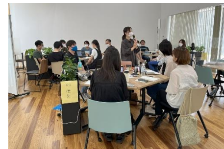
アーバンデザイン・スマートシティスクール

公共空間の利活用を通じ、市民が思い思いの時間を過ごす多様なまちなかの居場所作りを後押しし、シビックプライド向上や、市民が主体となったまちづくり活動の継続・発展を図る。