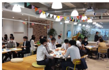
松山市でのワークショップの様子