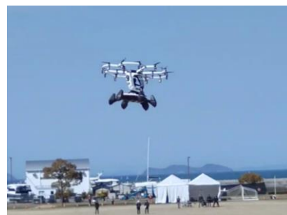
新居浜市での飛行実験

「空の移動革命推進ネットワーク」の活動促進として今後の展開も視野に入れた取組を行っております。