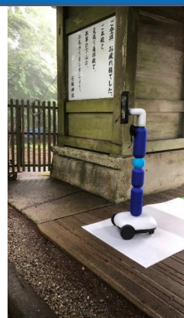
石鎚神社の様子を伝えるアバターロボット

今後も県内外のスタートアップとの連携促進により、新たなイノベーションの創出、地域経済の活性化を目指し、愛媛県の発展に寄与する活動を支援します。