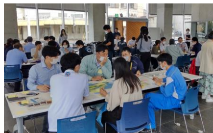
今治市でのワークショップの様子

今後も関係各所との調整、有識者紹介、国の政策や各自治体の最新動向を提供など愛媛県及び県内自治体における「空の移動革命」の展開につぎまして取り組んでまいります。