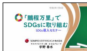
SDGs普及啓発セミナーで使用した資料