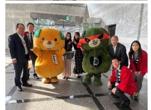
愛媛県フェア開催時の様子