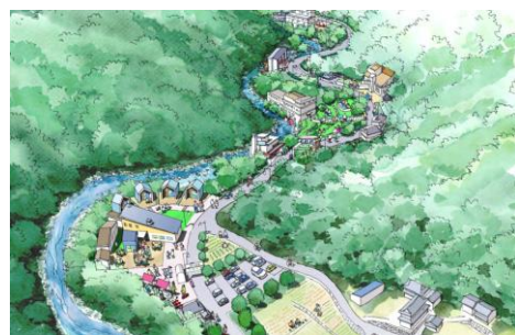
鈍川温泉エリアの整備イメージ