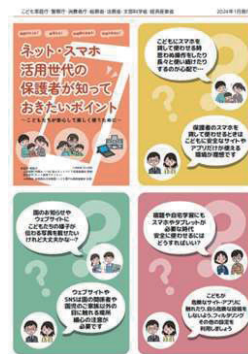
ネット・スマホ活用世代の 保護者が知っておきたい ポイント