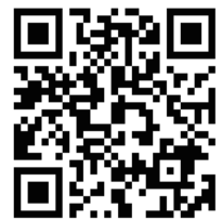
こども家庭庁 普及啓発リーフレット集