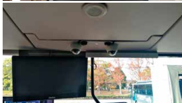
デジタルドライブレコーダー