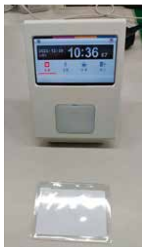
タイムレコーダー

令和 5 年 10 月よりタイムカードを順次、IC カードへ移行し、12 月よりタイムカードを廃止しました。また、バスの全車両にデジタルドライブレコーダーを設置しました。