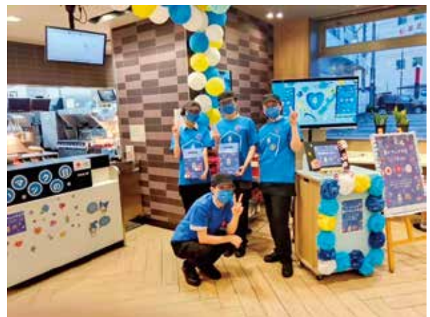
青いマックの日募金活動