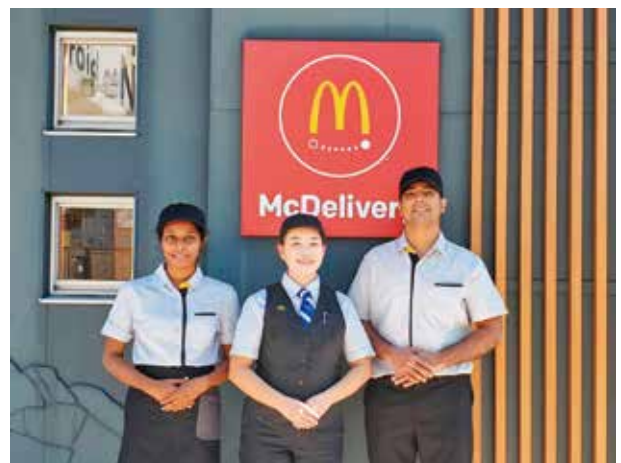
ダイバーシティの雇用促進