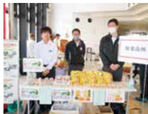
青パイヤミックスキムチイベント販売