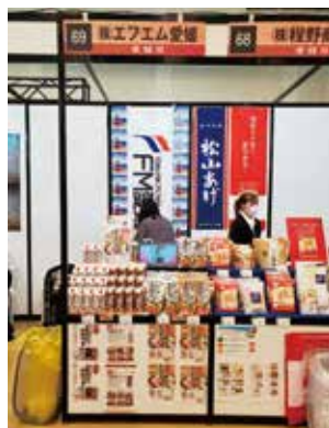
お四国鍋つゆ旭食品展示会