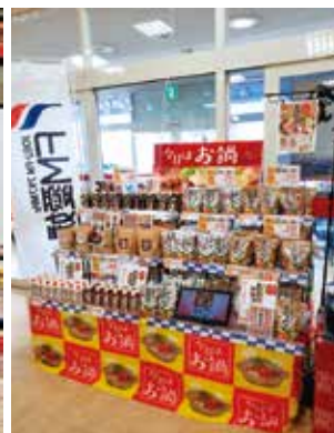
お四国鍋つゆ店頭