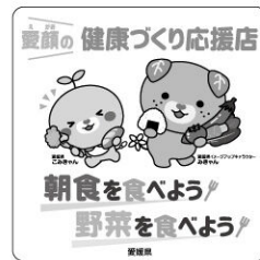
「愛顔の健康づくり応援店」ステッカー