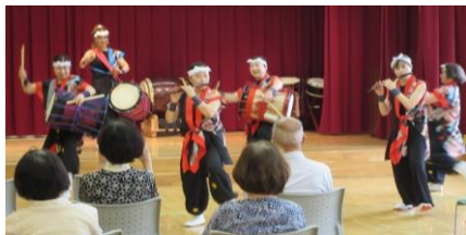
【①和太鼓演奏・南京玉すだれ】

○ 今後も参加者には観るだけ、聴くだけでなく必ず一緒になって参加できる内容を組み入れることで、より楽しんでもらえるよう工夫していきたいと思ひます。(主催者)