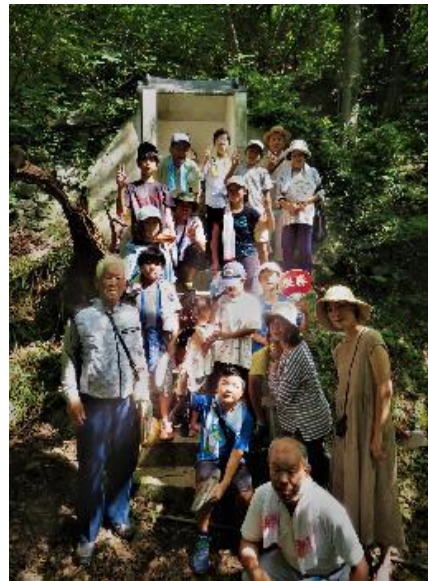
【松首地蔵前で集合写真】

○ 7月の猛暑の中での開催ですが、参加者は暑さも気にせず元気に歩かれ、ゴール後のかき氷は格別ようです。(主催者)