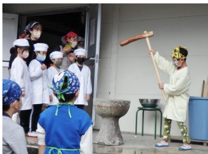
【ヨイショの掛け声で】