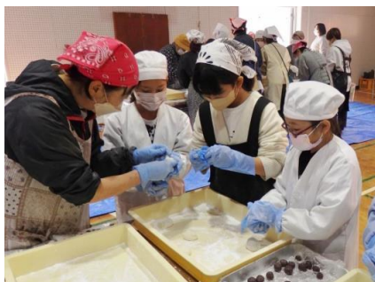
【あんの包み方を教えてもらう様子】