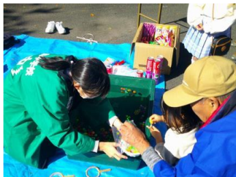
【ちびっこコーナー】