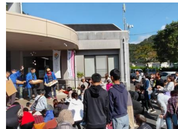
【餅まき&お菓子まき】