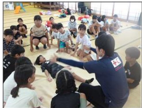
【日赤愛媛支部と救助体験】

1日目 16時集合 夕食準備 花火 肝試し 映画鑑賞会 2日目 ラジオ体操 朝食 防災学習会 炊き出し準備など (日赤愛媛支部 日赤奉仕団)