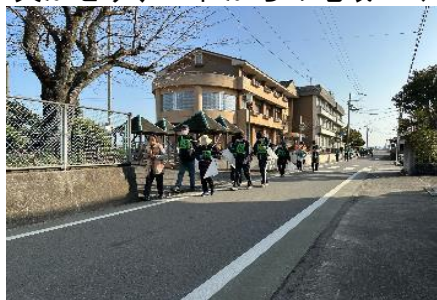
【ウォーキングで体カづくり】

令和4年度は、新型コロナウイルス感染予防のため、参加者全員での昼食は中止となりましたが、多くの方に参加していただきました。準備や運営には関係団体との連携が欠かせず、これからの地域づくりのためにも継続していきたい事業の一つです。