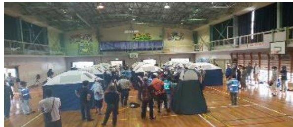
【避難所簡易テント等設置訓練】

○ 自主防災会では、令和4年度から夏と冬の年2回厳しい時期に避難防災訓練を実施してきた中で、温暖な時期にしてほしいという意見もありました。しかし、いつ起こるかわからない災害に対して今後とも時期に関係なく避難防災訓練を実施していきたいです。（主催者）