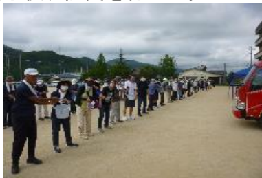
【参加者によるバケツリレー】