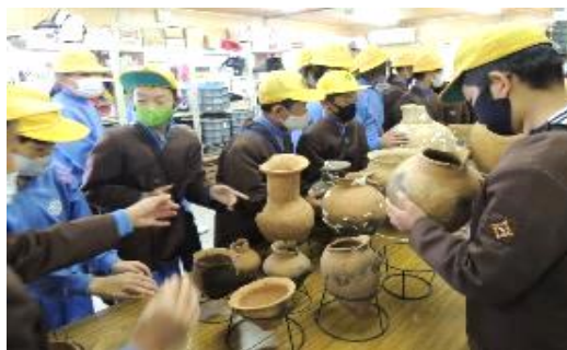
【出土品を手に取る児童】

また、県下でも最大級の埋蔵文化財があり、その発掘現場の見学や出土品も手で直に触るなど初めてのことがいっぱい、児童たちもとても勉強になりました。