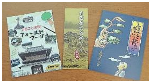
【歴史散策等の冊子】

吉岡歩こう会は、散策マップ・名所旧跡紹介・歴史人物紹介・伝統行事・昔ばなし等からなる冊子を作成しました。また、昔ばなしだけを集めた「ふるさとおもしろ昔ばなし」も作成し、毎年、卒業児童に進呈するなど活用しています。