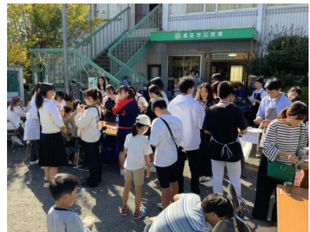
【地区の交流イベントの運営】

大学のない南予地域における中学生～大学生までの世代を超えるプログラムは、将来像を考えるきっかけとなっています。また、参加高校生が愛媛大学に進学したり、ホリバタに来ていた高校生が大学生になってプロジェクトに参加したりするなど、少しずつ循環も生まれています。