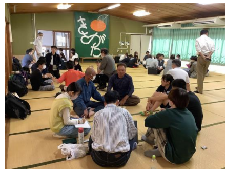
【地域の方へのヒアリング調査】

様々なテーマを通して、地域や社会を知ると共に中学生、高校生、大学生の世代を越えた交流は、自分の少し先の未来を描く機会にもなります。