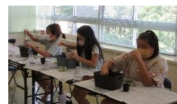
【多肉寄せ植え教室】