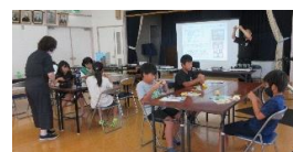
【出前エネルギー教室】