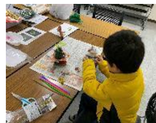
【クリスマス飾り作り】

○ 子どもたちが楽しく活動しているところ見て、事業を実施してよかったと感じました。来年も子どもたちが楽しめる内容を考え、事業を実施したいと思います。(主催者)