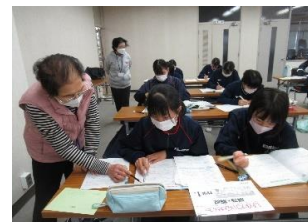
【インターバル学習】

メニューも自分たちで考え、飲み物やお菓子、手作りチョコレートフォンデュなどを提供しました。