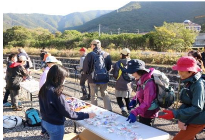
【各所で行われるお接待。笑顔が一番のお接待です。】