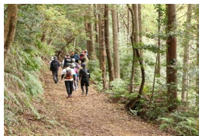
【自然豊かなへんろ道を歩く参加者】

平成10年度から実施しています。令和2年度、3年度は新型コロナウイルス感染症の影響で中止となりましたが、令和4年度から再開して実施しています。令和6年度は、11月16日（土）、17日（日）の2日間で開催する予定です。