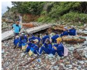
【 史 跡 巡 り 】