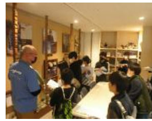
【 ミュージアム見学 】