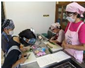
【 郷 土 料 理 】