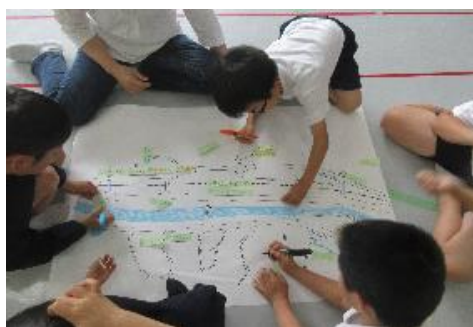
【支援員さんいわく、妄想タイムを楽しむ子どもたち】

公民館のロビーに張り出し、保護者や地区の方に楽しんで頂いたなかで、駄菓子屋と書かれたものを見た方が、野菜等の直売所に駄菓子コーナーを作ってくださいました。