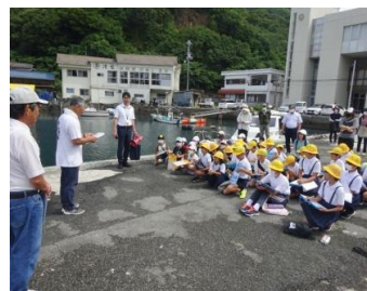
【和船競漕の歴史を学ぶ児童】

宇和島市津島町下灘地区の「和船競漕」（地元では押舟と呼ばれています）を継承していくため、数年前から学ぶ機会を設けてきました。令和5年度は和船競漕をより身近に感じてもらうため、初めて櫓(ろ)を漕ぐ体験を行いました。