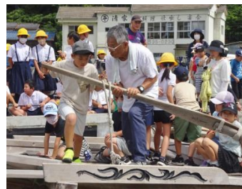
【カ一杯櫓(ろ)を漕ぐ児童】

地域学校協働活動の一環で、地元の小学校だけでなく近隣の小学校の児童も参加し、小学校区を越えて交流を図りました。押舟保存会に協力いただき、7月2、4、5日の3日に分けて2校の全校児童が実際に櫓(ろ)を漕いで下灘地区の伝統に触れました。（安全を考慮し、和船は棧橋に係留したまま体験しました。）